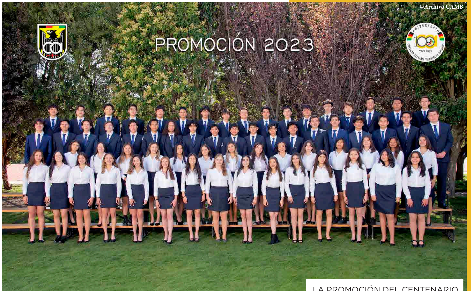
LA PROMOCIÓN DEL CENTENARIO