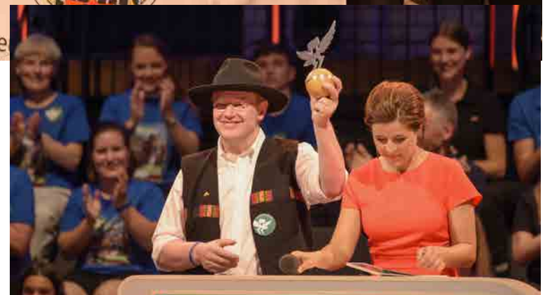
El Director del CAMB junto al equipo del Colegio reciben el Schulpreis - 2019