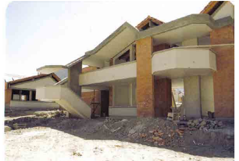
1988 - 1990 Construcción del actual Colegio en Achumani

Durante los años 80, recuperada la democracia en el país, el Colegio pudo crecer y fortalecerse. En 1983, tuvieron lugar los primeros juegos deportivos Bundesjugendspiele, en las canchas del Club Alemán. El 10 de mayo de 1991, en el 68 aniversario del Colegio, se inauguró el nuevo edificio en Achumani.