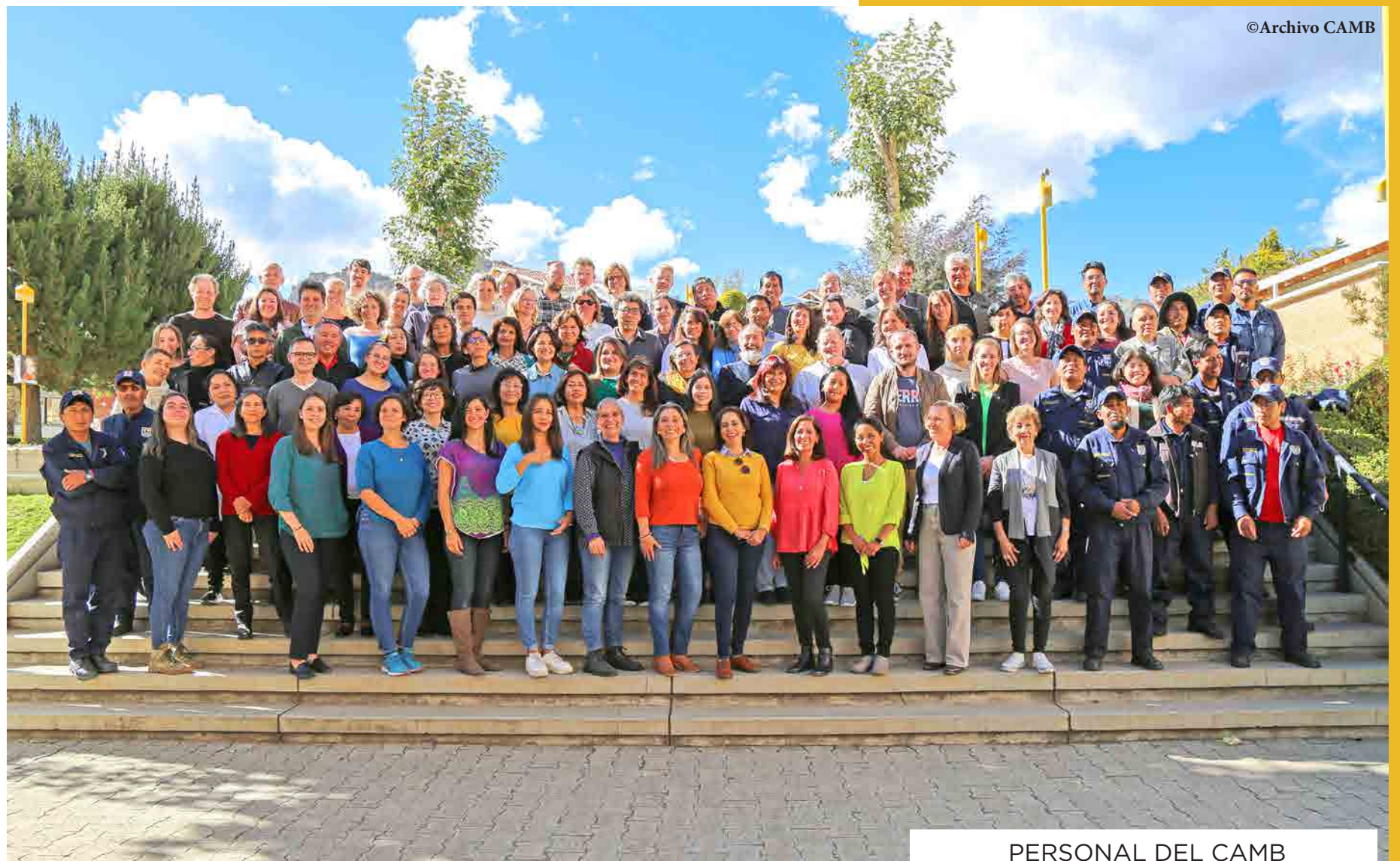
PERSONAL DEL CAMB MAYO 2023