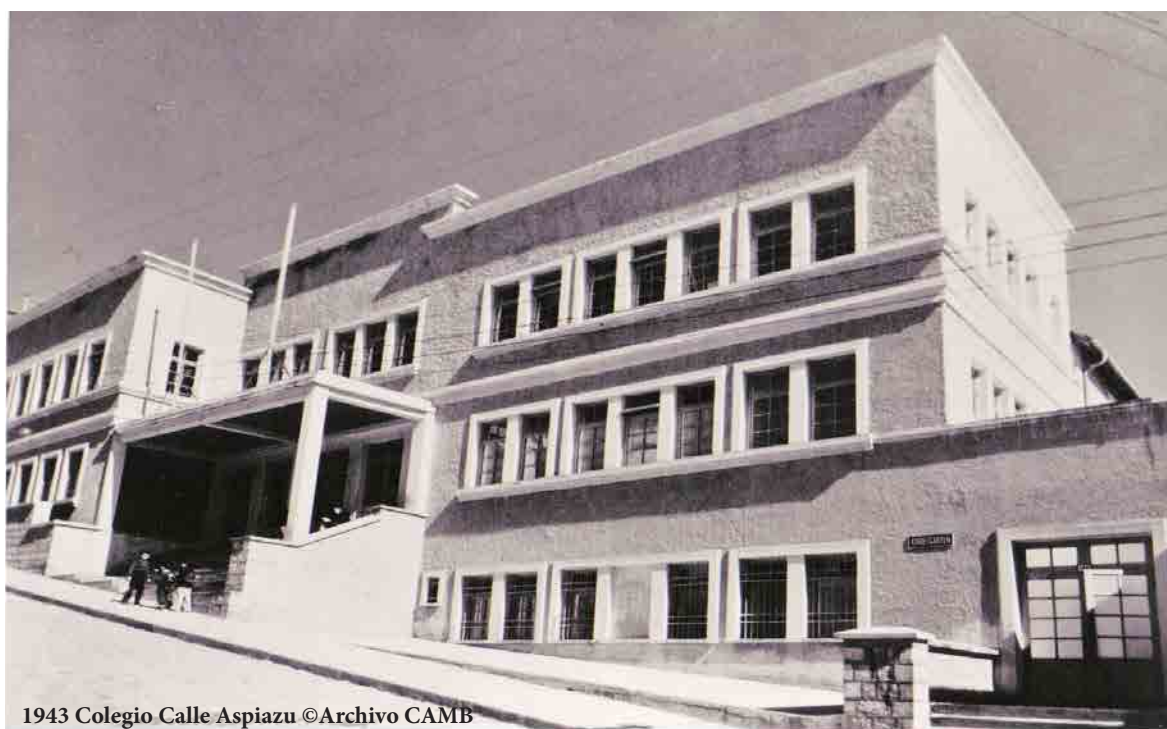
1943 Colegio Calle Aspiazu