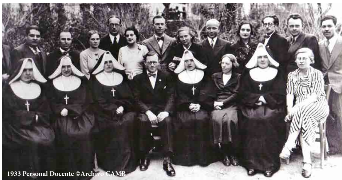
1933 Personal Docente